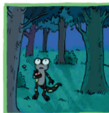
Je suis perdue, toute seule en pleine nuit !