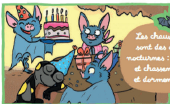
Joyeux anniversaire, joyeux anni... Sam, tu dors ???

Remettre des images dans l'ordre chronologique des événements. L'illustrateur a mélangé tous ses dessins ! Découpe les vignettes et colle-les dans l'ordre des événements pour raconter l'histoire de Sam, la petite Salamandre qui se rend à l'anniversaire de son amie Lily.