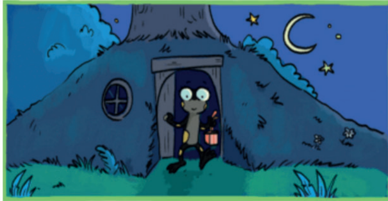
illustration de sam la petite salamandre / © Émilie Vanvolsem

Imaginer et écouter les bruits de la forêt. Sam se promène toute seule dans la forêt. Que voit-elle ? Qu'entend-elle ?