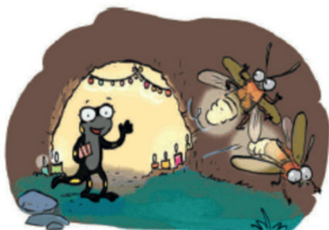
On est arrivés, la grotte est juste là. Merci, vous m'avez sauvée !