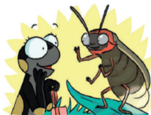
Ah ! Mes amies les lucioles ! On va te guider. Suis-nous !