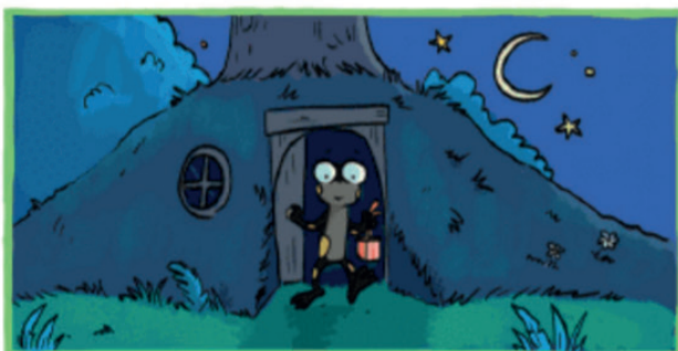
Ce soir, Sam est invitée à l'anniversaire de Lily la chauve-souris.