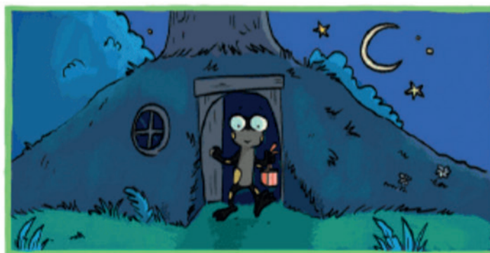
Ce soir, Sam est invitée à l'anniversaire de Lily la chauve-souris.