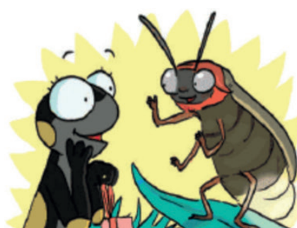
Ah ! Mes amies les lucioles ! On va te guider. Suis-nous !