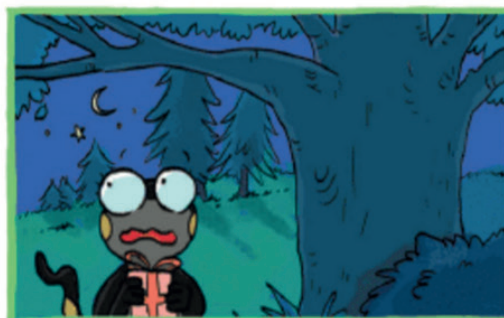
Oh... Il fait sombre, je ne reconnais plus le chemin...