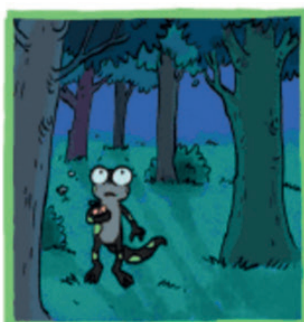
Je suis perdue, toute seule en pleine nuit !