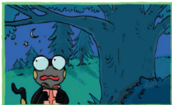
Oh... Il fait sombre, je ne reconnais plus le chemin...