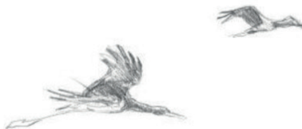
Cigognes noires

Tu es prêt pour le quiz-lecture ! Si tu hésites sur une des questions du quiz, parcours à nouveau ton magazine. La réponse s'y trouve forcément. C'est parti !