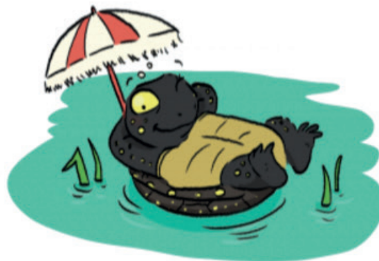
Cistude qui prend un bain de soleil

Tu es prêt pour le quiz-lecture ! Si tu hésites sur une des questions du quiz, parcours à nouveau ton magazine. La réponse s'y trouve forcément. C'est parti !