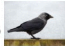
Choucas des tours

Oiseau entièrement noir, y compris le bec et les pattes. Son vol est lourd. Pour chanter, cet oiseau élève la tête très haut et fait un cri grave et long.